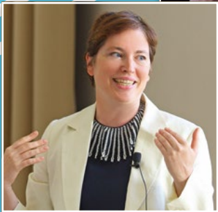
Impressionen vom creativ verpacken dialog 2023